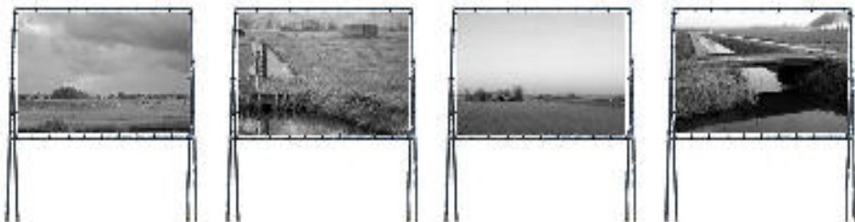
Voorbeeld van de doeken

De tentoonstelling is de hele zomer te zien; vanaf de officiële opening van het Creatief Evenement op 12 juni tot aan de sluiting op 12 september, tijdens de 3 e Slochter Molendag.