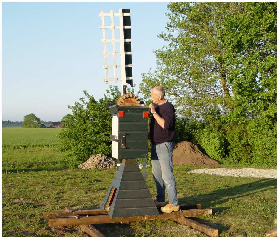
Herplaatsing bij De Ruiten

Feitelijk is de bekleding en het wienenkruis van het molentje vernieuwd. Het oorspronkelijke materiaal was namelijk zo slecht dat hergebruik niet verstandig was. De constructiedelen van zowel de ondertoren als de kop, waaronder stijlen, balken, bovenas, askop, wielen etc. zijn echter allemaal