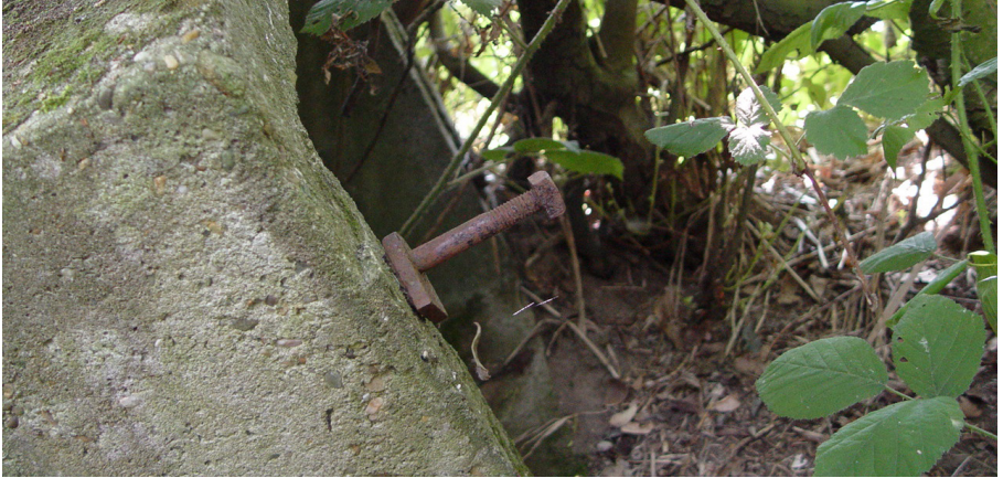
Betonnen restant

Het molentje werd daarop verplaatst naar de werkplaats van de heer Nijboer te Kolham, die niet alleen de ruimte beschikbaar stelde maar ook adviseerde over de herstmethode. Het bleef niet bij advies: het molentje had zo'n aantrekkingskracht dat hij volop meewerkte aan het herstel en later nog een kopie-molen heeft gemaakt. De heer Diek Medendorp heeft, ook al volledig belangeloos, gevluucht van het molentje hersteld. Medendorp, overleden in 2011, was een bekend Groninger molenbouwer.