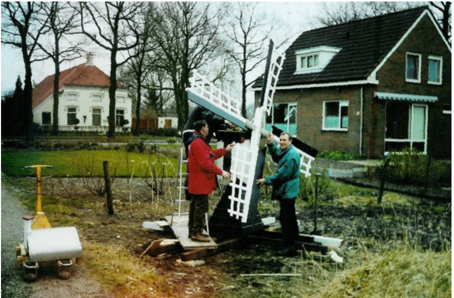
Proefopstelling met wiekenkruis

Het molentje werd daarop verplaatst naar de werkplaats van de heer Nijboer te Kolham, die niet alleen de ruimte beschikbaar stelde maar ook adviseerde over de herstmethode. Het bleef niet bij advies: het molentje had zo'n aantrekkingskracht dat hij volop meewerkte aan het herstel en later nog een kopie-molen heeft gemaakt. De heer Diek Medendorp heeft, ook al volledig belangeloos, gevluucht van het molentje hersteld. Medendorp, overleden in 2011, was een bekend Groninger molenbouwer.