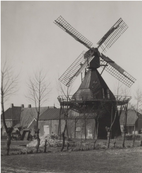
Figuur 6A en -B: Collectie Vereniging De Hollandsche Molen