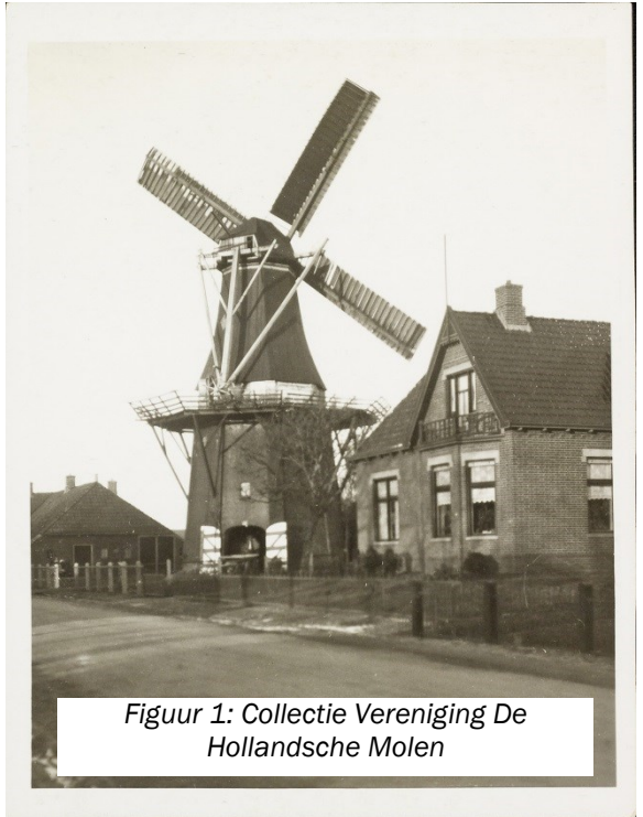
Figuur 1:

Vlucht: 68 voet (bijna 21 meter); zelfzwiching