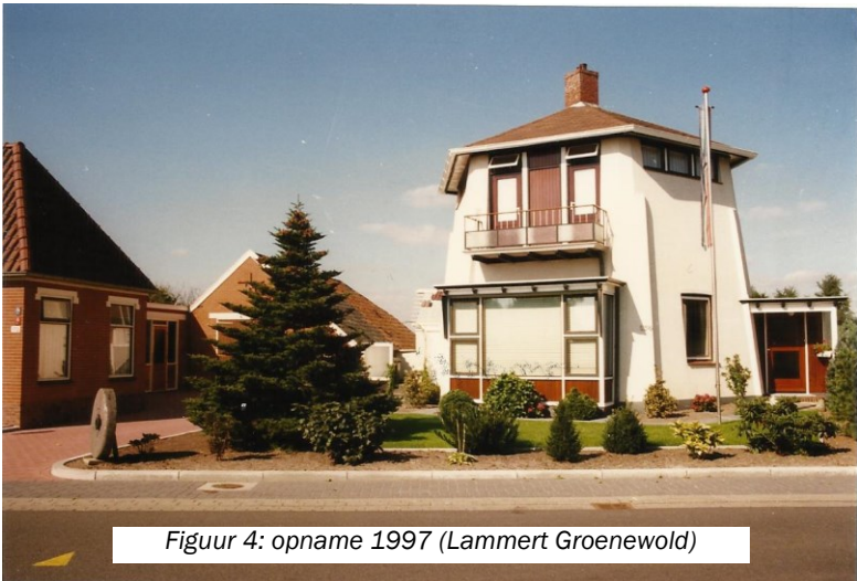
Figuur 4: opname 1997

De molen had een zeskante onderbouw, met rietgedekte zeskante bovenbouw en een lage stelling. Het gevlucht was voorzien van zelfzwichting op beide roeden. De molen had één koppel maalstenen. In april 1945 werd de molen ernstig beschadigd tijdens gevechten tussen bevrijders en bezetters. De romp werd gespaard en doet sindsdien dienst als woonhuis. Op deze plaats stond een molen sinds 1686.