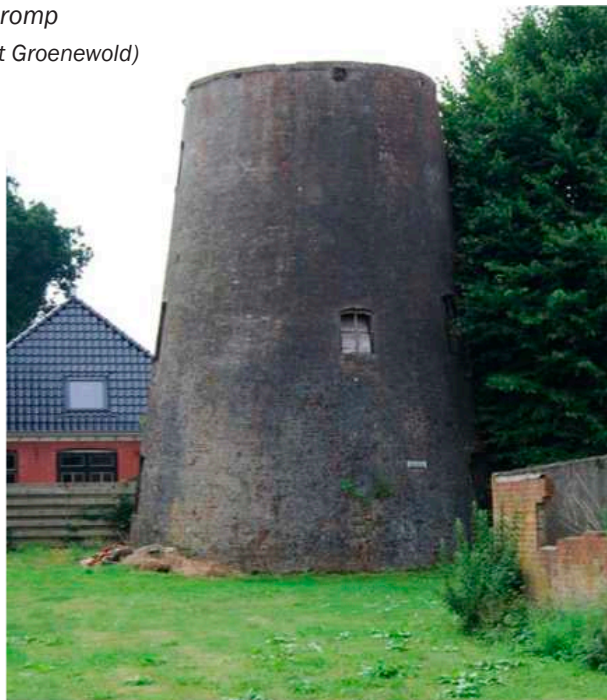
11 juli 2008 De romp