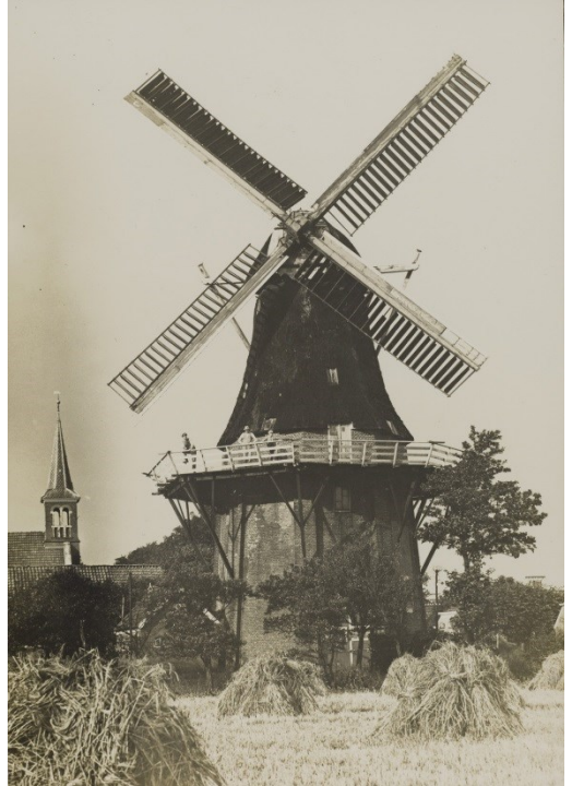
Figuur 5A en -B: Collectie Vereniging De Hollandsche Molen

Deze molen had een acht-kante stenen onderbouw met acht-kante rietgedekte bovenbouw en zelfzwiching op beide roeden. Sinds 1896 was er een petroleummotor als hulpbron. Op deze plaats stond voordien een standerdmolen.