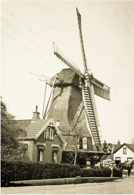
Figuur 3: