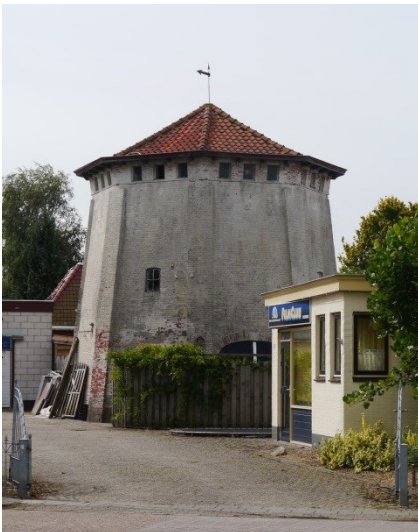
Figuur 2: Opname 2013 (Henk Helmantel)

In 1936 werd een Lister motor geplaatst, die later werd vervangen door een Heemaf motor. In 1942 stond de molen met één roede. In 1945 werd de molen ernstig beschadigd, waarna hij nog enkele jaren doormaakte met één roede. Het achtkant werd afgebroken in 1948 en de romp staat er nog steeds.