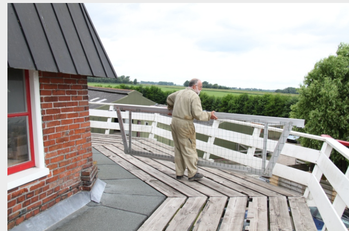
Veiligheid voor alles, dus hekken plaatsen