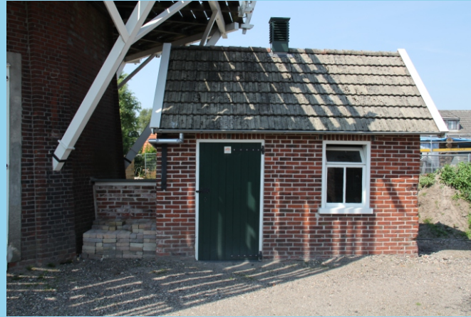
Het volledig gerestaureerde motorhuisje

Daar was een Bronsmotor geplaatst in een naast de molen gemaakt schuurtje. Brons was een bekende Groninger motorenbouwer uit Wagenborgen, die in Appingedam zijn motoren bouwde. Het motorhuisje is nog steeds aanwezig, maar was erg vervallen. In de afgelopen jaren is het gerestaureerd en na een lange zoektocht is er óók weer een Bronsmotor gevonden, die net als het huisje weer in ere hersteld is. De feestelijke opening van het huisje met daarin de Bronsmotor werd op 10 september 2021 verricht door Gedeputeerde Paas.