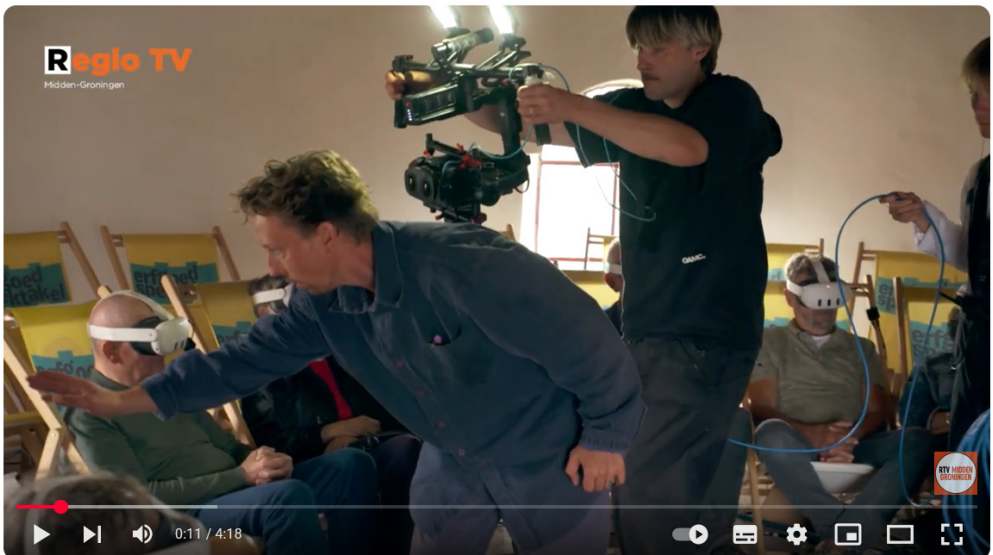
Bezoekers ervaren een toneelstuk in virtual reality; door het oog van de molen

In Kolham stonden 30 ouderwetse geel-wit-gestreepte strandstoelen klaar en bij iedere stoel een VR-bril en koptelefoon. Tijdens het aanmeten van de bril klonk er live pianomuziek op de achtergrond. Je waande je meteen al in een andere wereld, zogauw je de VR-bril op had. Je zweefde door de nok van de molen, voelde de wind langs de wiken en belandde in droombeelden waar natuur en mechaniek in elkaar overvloeiden. Het publiek werd ondergedompeld in een universum waarin molen, landschap en mens één geheel vormden. Een fantastische