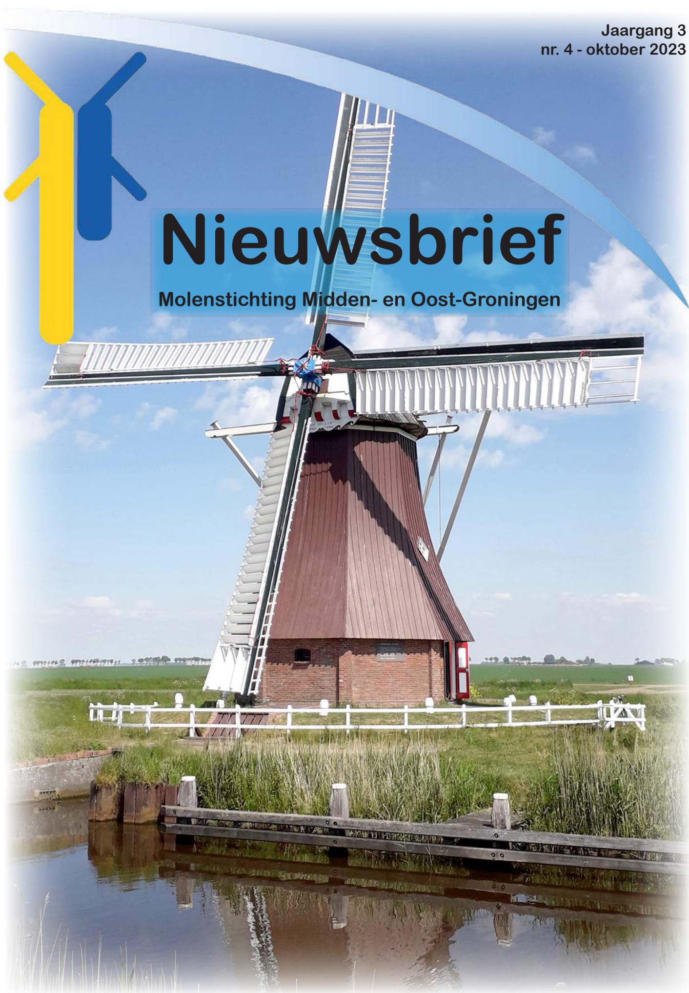
De Dellen - Nieuw Scheemda

Molenstichting Midden- en Oost-Groningen