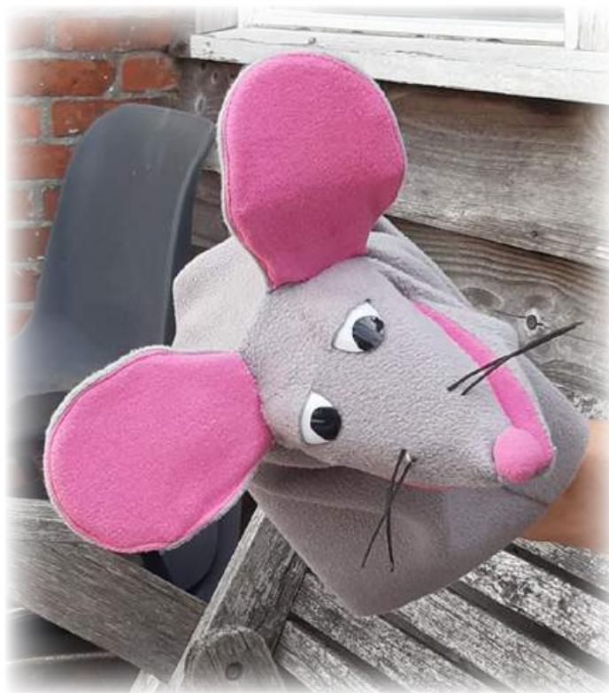
Handpop gemaakt door Lex van der Gaag

Anderhalve week later stonden er 95 vmbo-brugklassers op de stoep! Weliswaar over twee dagen verdeeld, maar het was een flinke klus. In het kader van het project 'Verken je omgeving' fietsten ze van Hoogezand naar Slochteren of naar Harkstede. Behalve de Fraeylemaborg stonden De Ruiten (Slochteren) of Stel's Meulen op het programma.